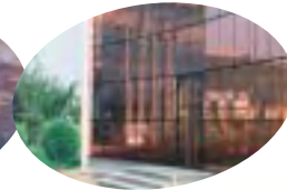
Film Cuivre 77 Cristal Rejet infrarouge jusqu'à 74%