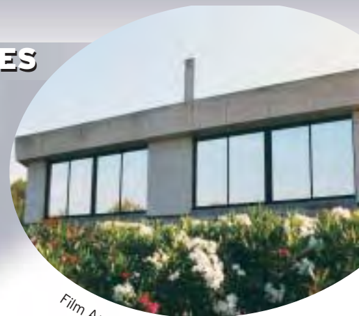
Film Argent 80 C

En été surtout, la chute de température est immédiate. La visibilité est automatiquement régulée, et l'éblouissement est également supprimé. Certains films permettent même d'écarter les vis-à-vis de façon optique ou partielle avec une vision vers l'extérieur, sans être vu !