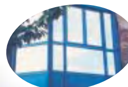
Film Argent 80 C Pose extérieure Rejet infrarouge jusqu'à 80%

...les films Solar Screen s'intègrent parfaitement dans différentes architectures anciennes et récentes. Selon la grandeur des surfaces vitrées, nos professionnels vous suggèrent des films de densité métallique différente, répondant aux besoins de luminosité intérieure.